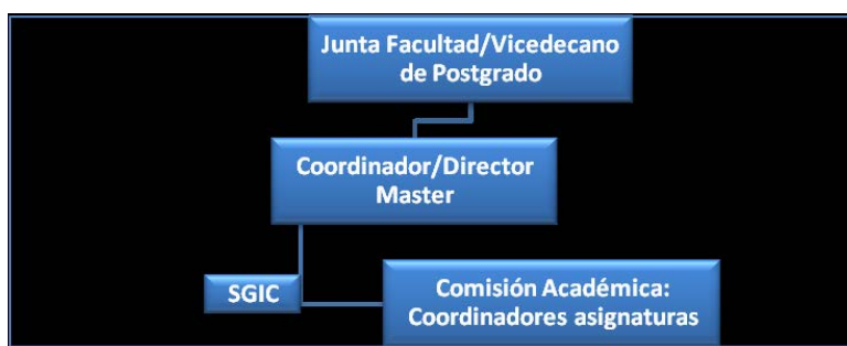
Figura 2.1. Esquema de la coordinación del Máster en Virología

Durante el periodo de planificación docente los Coordinadores están constantemente en contacto por vía telemática actualizando la información. La Comisión Académica mantiene al menos, en circunstancias normales, dos reuniones semestrales, este año mucho más frecuentes debido a las actualizaciones de información sanitaria. En la primera reunión, se ofrece una información general previa sobre admisión de nuevos alumnos, se establecen las bases para la coordinación de las clases teóricas, prácticas y TFM. Esta información está a disposición de los usuarios al Espacio Común del Máster en Virología y se actualiza en la página web ( https://www.ucm.es/Mástervirologiaucm/plan-de-estudios ). Este curso 2019-20 se añadió a la página web un aviso sobre la presencialidad adaptada para el nuevo curso.